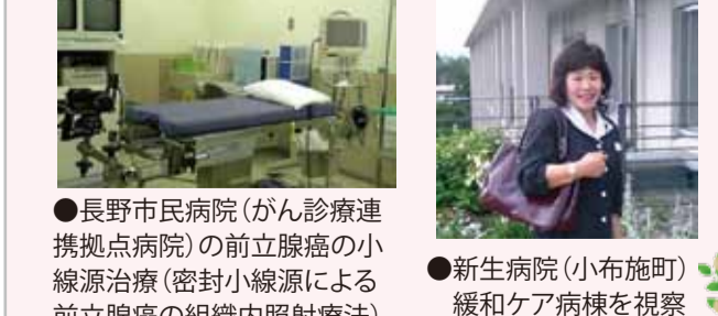
●長野市民病院(がん診療連携拠点病院)の前立腺癌の小線源治療(密封小線源による前立腺癌の組織内照射療法) ●新生病院(小布施町)緩和ケア病棟を視察

秋に策定予定の県がん対策アクションプランに向けて提言を纏めるべく積極的に現地調査を展開中です。